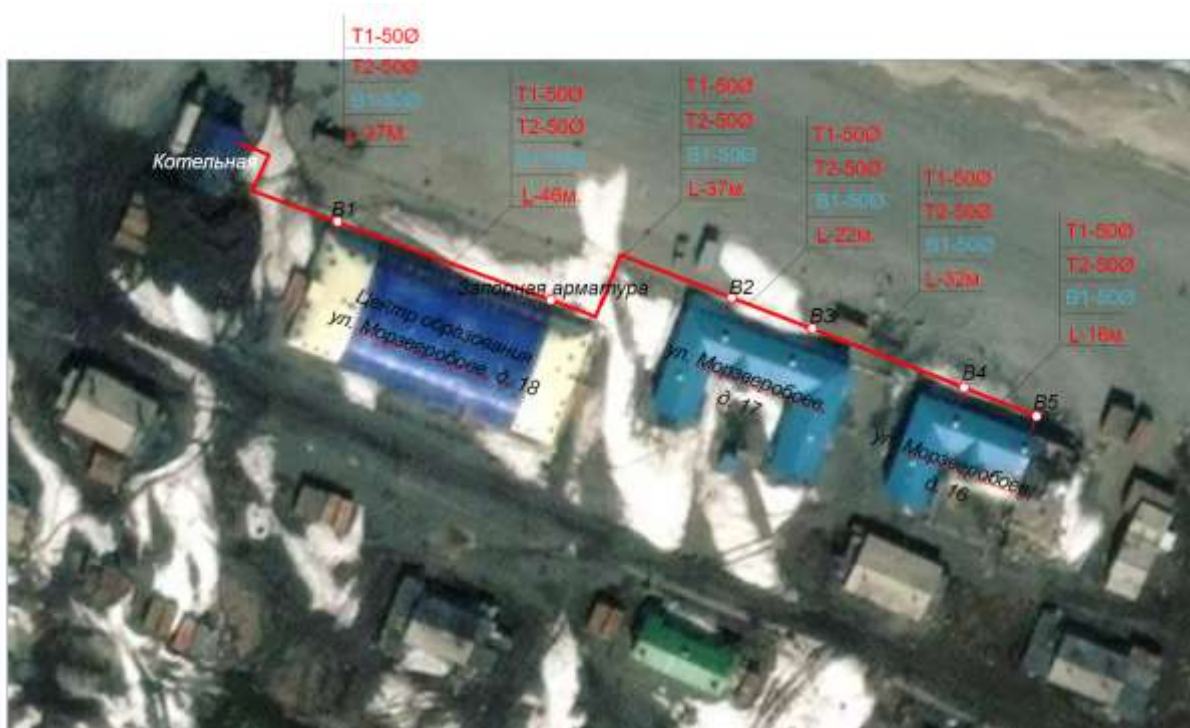
Рисунок 1.2.1.1– Существующие зоны действия систем централизованного теплоснабжения

Существующие зоны действия систем централизованного теплоснабжения приведены на рисунке 1.2.1.1.